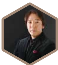
子どもたちが豊岡で 世界と出会う音楽祭