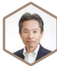
子どもたちが豊岡で 世界と出会う音楽祭