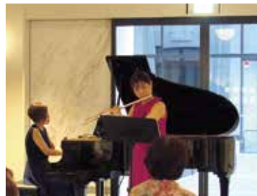
2022年 イブニングコンサート