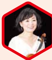
中澤 きみ子 Kimiko Nakazawa 〈ヴァイオリン〉

国際的に活躍するヴァイオリニストとして、特にモーツァルトの演奏では評価が高い。新潟大学を卒業後、ザルツブルグ・モーツァルテウム音楽院にて研鑽を積み、2000年に文化庁芸術家海外派遣員としてウィーンに留学。国内外のオーケストラと多数共演。CDも数多くリリースし、中でもモーツァルトの「ソナタ全集」及び「協奏曲全集」等が高く評価を受けている。また国際コンクールの審査員や、国際音楽祭の講師として数多く招聘されている。尚美学園大学、同大学院客員教授、上野学園大学客員教授を歴任。震災後、ライフワークとしてTSUNAMIヴァイオリンの演奏にも熱心に取り組んでいる。