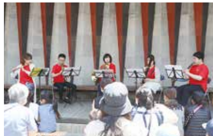
2022年 街角コンサート(城崎、木屋町小路)