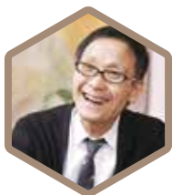
子どもたちが豊岡で 世界と出会う音楽祭